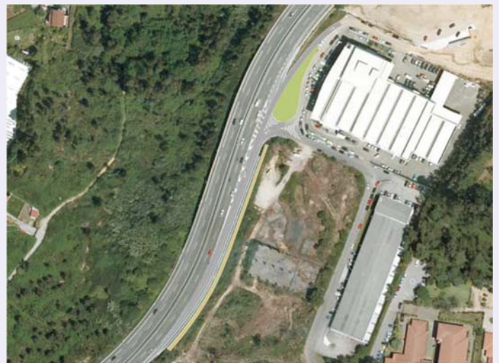
Estado futuro de la zona de actuación.