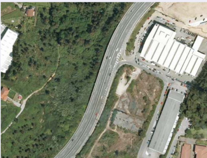
Estado actual de la zona de actuación.