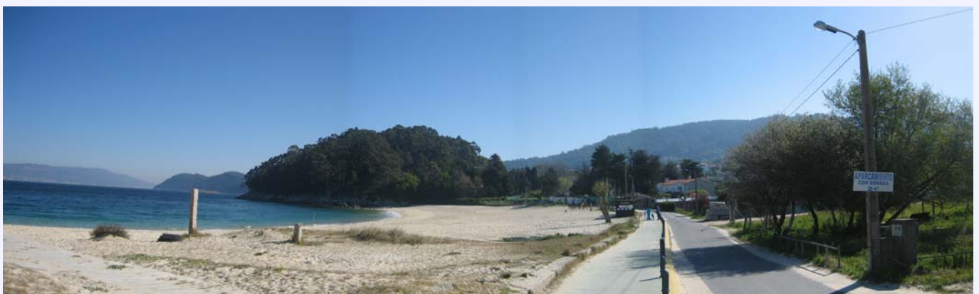
Estado actual zona de proyecto Playa de Agrelo.