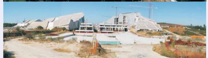
Estado actual zona de actuación.