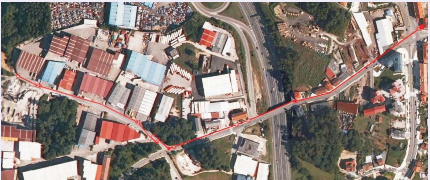
Ortofoto de la zona de actuación