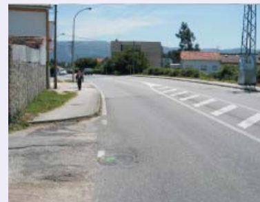
Drenaje y saneamiento.