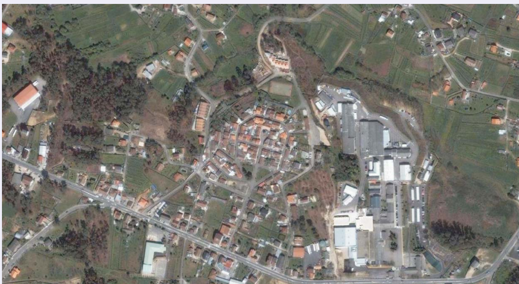
Vista aérea del ámbito de estudio.