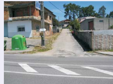
Drenaje y saneamiento.