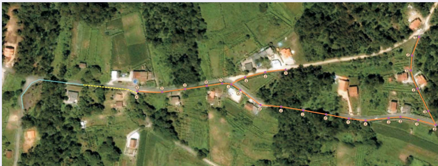
Fotomontaje del ámbito de actuación.